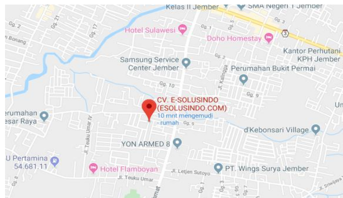
Gambar 0.1 Peta lokasi kantor CV. E-SOLUSINDO.

Kegiatan Praktek Kerja Lapang (PKL) ini dilaksanakan di CV. E-SOLUSINDO, yang dimulai dari tanggal 17 Februari 2020 sampai dengan 18 Mei 2020. Lokasi kegiatan praktek kerja lapang adalah pada CV. E-SOLUSINDO yang kantor berada di Perum. Demang Mulia No.A-16, Lingkungan Krajan, Kebonsari, Kec. Sumbersari, Kabupaten Jember, Jawa Timur 68121. Berikut merupakan peta lokasi kantor CV. E-SOLUSINDO