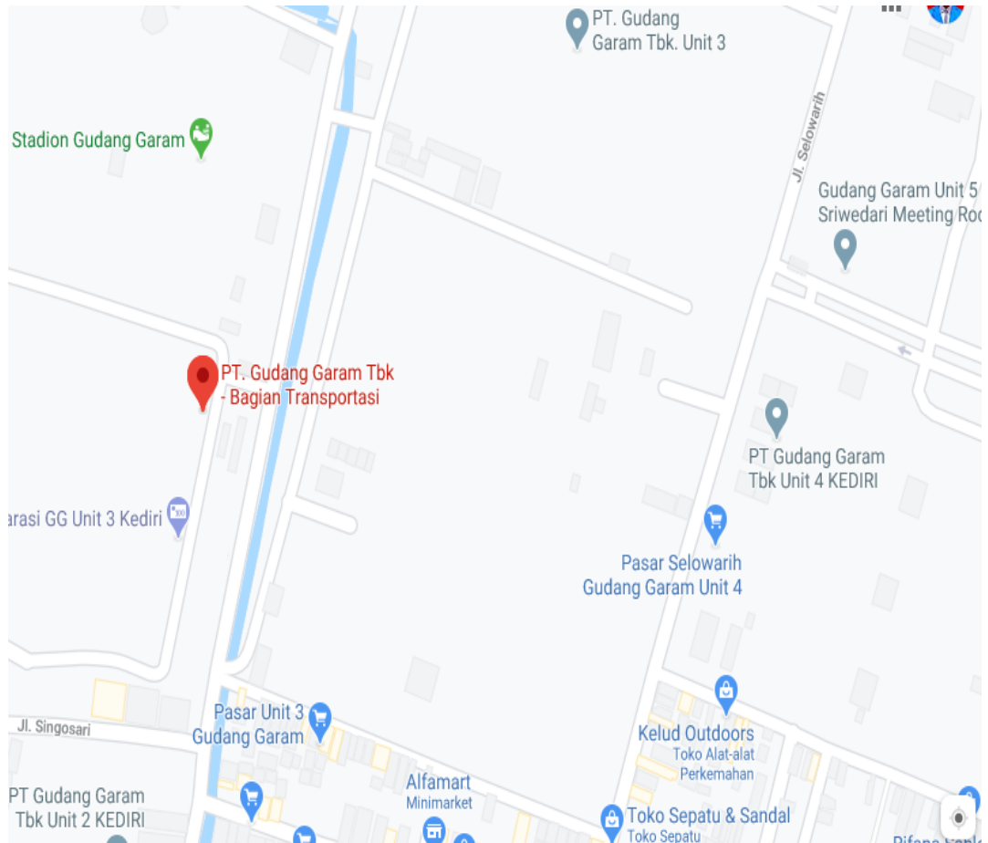
Gambar 1.1 Peta Lokasi PT Gudang Garam Tbk

Peta lokasi dari PT Gudang Garam Tbk dapat dilihat pada gambar 1.1 berikut: