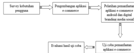
Gambar 1. Metode Kegiatan Pengabdian Masyarakat

Saat ini penggunaan media sosial untuk meningkatkan penjualan sudah banyak dilakukan. Melalui media sosial pelaku bisnis dapat langsung berinteraksi dengan calon pelanggan dan pelanggan. Media sosial yang digunakan pada pelatihan ini adalah facebook, instagram, twitter dan whatsapp.