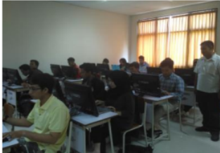
Gambar 3. Pelatihan pemanfaatan e-commerce berbasis android

mendukung proses bisnis yang ada di UKM penjualan baju dalam hal ini Hamzah Collection. Pelatihan diikuti oleh karyawan Hamzah Collection dan bertempat di Jurusan Teknologi Informasi. Luaran dari kegiatan pelatihan ini karyawan Hamzah Collection mampu menggunakan dan memanfaatkan secara maksimal aplikasi e-commerce yang sudah dibuat pada tahapan sebelumnya. Pada tahapan ini juga e-commerce Android diintegrasikan dengan digital branding melalui media sosial facebook, instagram, twitter dan whats app.