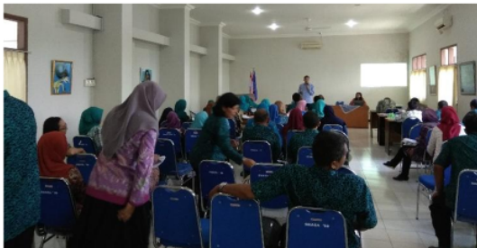
Gambar 2. Foto Ditengah Kegiatan Pelatihan di Aula Madya SMAN 1 Jember.

Pada pelaksanaannya program pengabdian berjalan lancar, dimana peserta pelatihan antusias, dan bahkan meminta diadakan kegiatan serupa dilain kesempatan, terlihat pada Gambar 2, 3 dan 4. Hal ini tentu mengindikasikan bahwa program pengabdian yang dilakukan diterima dengan baik sekaligus dirasakan memberikan guna-manfaat yang positif bagi guru-guru.