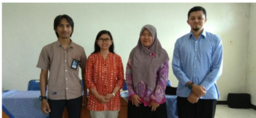
Gambar 4. Foto Bersama Pemateri

Kegiatan ini sendiri diikuti oleh 52 guru dengan komposisi guru SMAN 1 Jember dan guru-guru perwakilan dari MGMP-Biologi Kab. Jember. Kegiatan ini mendatangkan pelatih Mendeley bersertifikat internasional untuk mengampu kegiatan pelatihan Mendeley, dan mendatangkan ahli PTK untuk mengisi bagian penelitian tindakan kelas. Foto akhir kegiatan ditunjukkan oleh Gambar 5 dan 6.