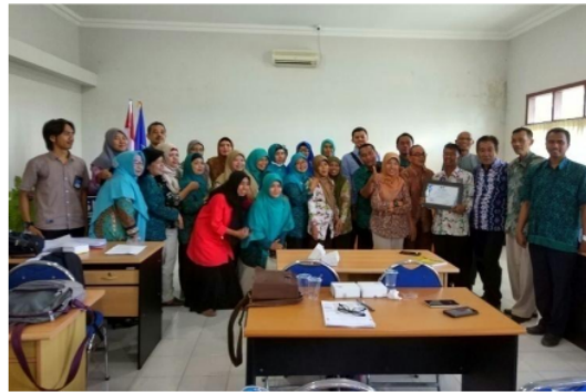
Gambar 6. Foto Bersama Pemateri dan Peserta