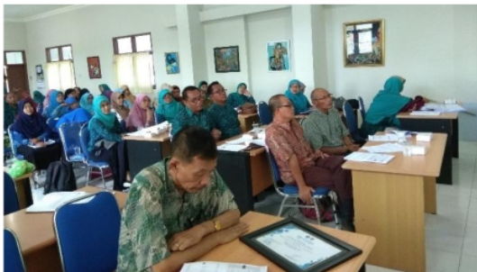
Gambar 3. Foto Peserta Mengikuti Kegiatan dengan Serius