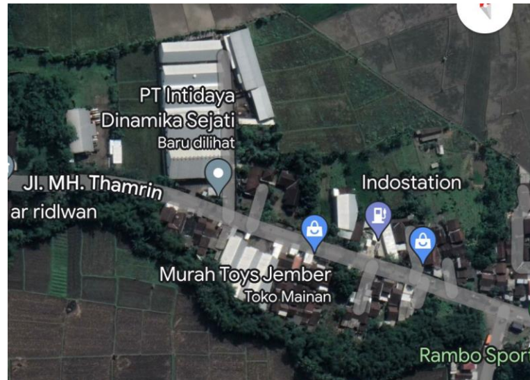
Gambar 1.1 Peta Lokasi PT Intidaya Dinamika Sejati