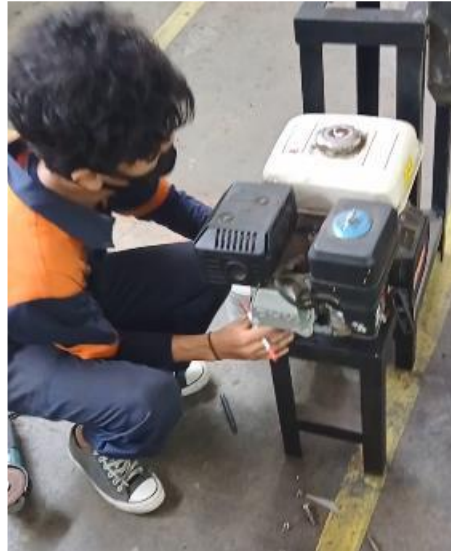
Gambar 1. 2 Mesin Penggiling Dengan Motor Bensin

penggantian oli dan penggantian komponen lainnya. Desain alat dapat dilihat pada Gambar 1.2 di bawah.