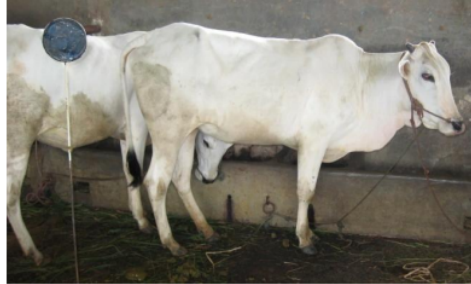
Gambar 1. Tampilan perekaman citra sapi

Perekaman citra sapi dilakukan menggunakan kamera CCD dengan LiveCam Visa IM dengan resolusi 288 x 352 piksel seperti Gambar 1. di bawah ini. Hasil perekaman digitasi disimpan dalam memori hardisk untuk analisis citra lebih lanjut.