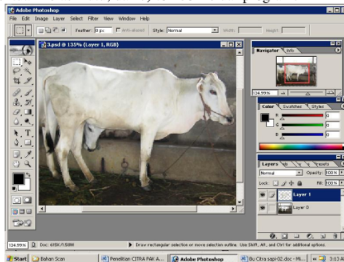
Gambar 2. Tampilan awal program pengolahan citra

Program pengolahan citra sapi ini terdiri dari tombol-tombol yaitu: 1) tombol untuk mengambil (load) citra yang tersimpan dalam memori hardisk; 2) tombol untuk menyalin citra pada frame citra ke-2; 3) tombol perintah thresholding; 4) tombol binerisasi; 5) tombol perhitungan perimeter, panjang, lebar, dan luas proyeksi; 6) tombol penentuan kelas mutu; dan 7) tombol keluar program.