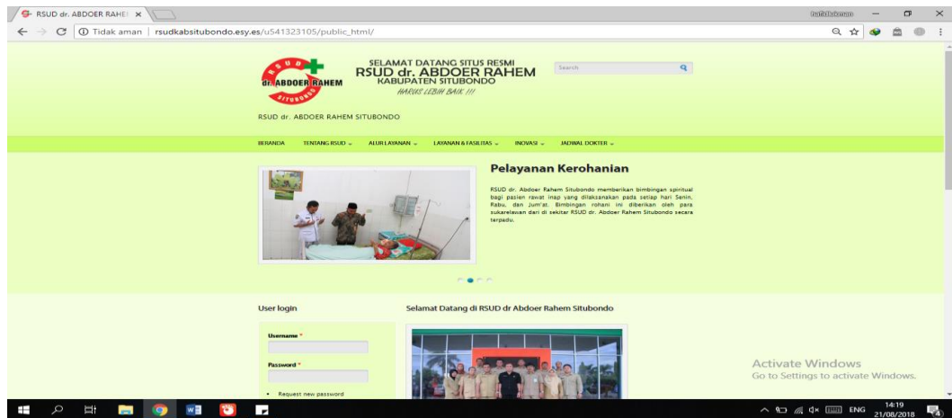
Gamabar 1. 2 website kedua

Gambar di atas adalah gambar website kedua dari rumah sakit terdapat kekurangan yaitu, tidak adanya menu informasi, berita, alur pendaftaran BPJS kesehatan pada rumah sakit, informasi harga kamar rawat inap dan informasi yang ada di dalam website tidak ter-update . Hal ini terjadi karena pembuatan website itu sendiri dibuat secara personal oleh bagian IT rumah sakit dan untuk mengelola isi website yang kedua tidak dapat dilakukan karena tidak adanya akses untuk laman website tersebut. Permasalahan ini menyebabkan penyampaian informasi kepada masyarakat melalui media website ini tidak seluruhnya tersampaikan. Website yang sudah ada saat ini masih banyak kekurangan karena tidak adanya pembenahan pada fitur sehingga menyebabkan tidak tersampainya informasi kepada masyarakat.