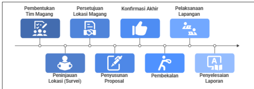
Gambar 1. 2 Metode pelaksanaan Magang

Mahasiswa membentuk tim magang sesuai preferensi masing-masing, dengan batasan anggota maksimal empat (4) orang per kelompok.