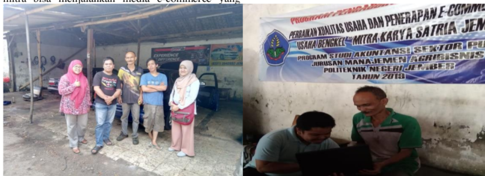
Gambar 2. Pelatihan blog e-commerce

dimilikinya, sehingga dapat bermanfaat untuk keberlanjutan dan pengembangan usaha yang dimiliki. Gambar 2 berikut menyajikan mengenai dokumentasi kegiatan pelatihan yang telah dilakukan.