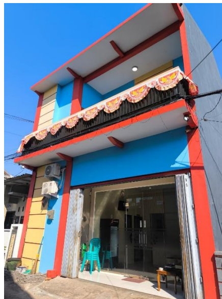
Gambar 1. 2 tampak depan lokasi Kantor Selatan