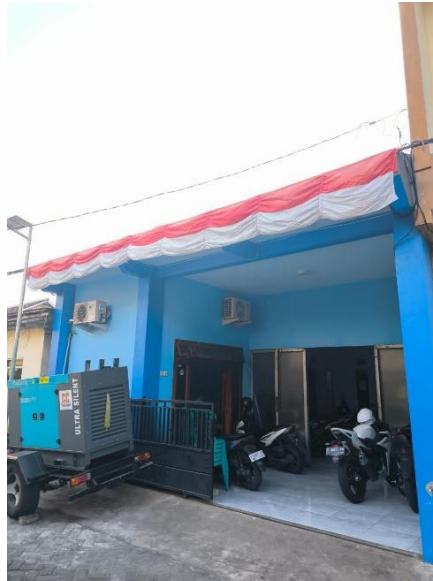
Gambar 1. 3 tampak depan lokasi Kantor Utara