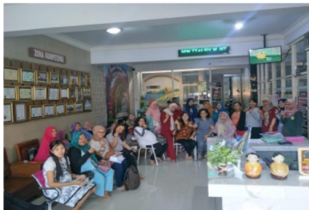
Gambar 2. Pelatihan, bimbingan, konseling tentang cara pengolahan pangan bergizi kepada ibu hamil