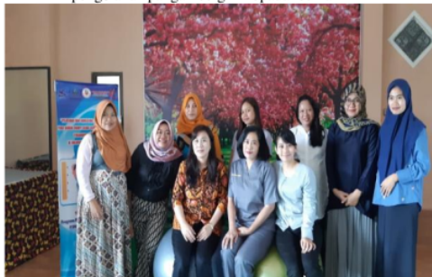
Gambar 3. Kegiatan pendampingan mitra (para bidan di rumah rumpi sehat)

Kegiatan pelatihan, bimbingan, konseling tentang cara pemilihan pangan bergizi yang diberikan kepada peserta (ibu hamil) berjalan dengan lancar dan sukses. Hal ini ditunjukkan dengan antusiasme para peserta pelatihan saat mengikuti kegiatan. Pemahaman peserta pelatihan tentang materi pemilihan pangan bernutrisi juga semakin meningkat dengan diadakannya kegiatan ini, terbukti dari kemampuan peserta saat menjawab pertanyaan yang diberikan pemateri.