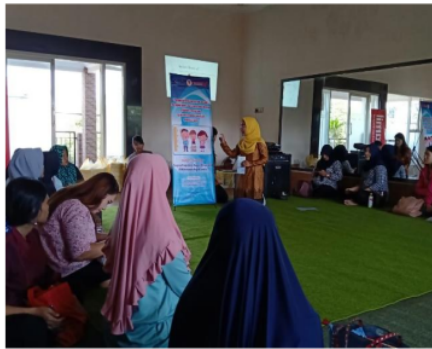
Gambar 1. Pelatihan, bimbingan dan konseling tentang cara pemilihan serta penyimpanan pangan bergizi kepada ibu hamil