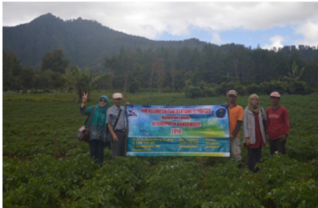
Gambar 1. Tim IbM (no 1, no2 dan no 4 dari kiri ke kanan) berada dilahan Demplot kentang berumur 30 hari setelah tanam, Jampit Sempol Kab. Bondowoso