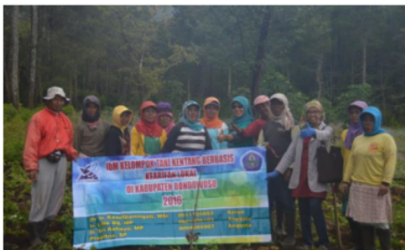
Gambar 2. Tim IbM foto bersama anggota kelompok tani mitra