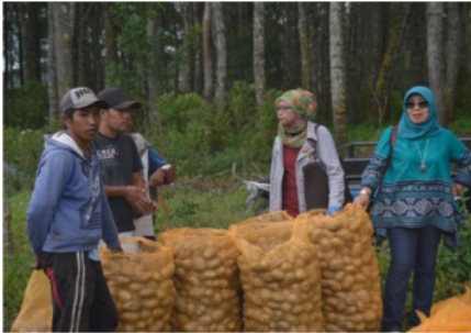
Gambar 7. Proses pengemasan hasil panen kentang kedalam karung plastic dan diikat dengan tali raffia, berat per kemasan 8-9 kg/karung