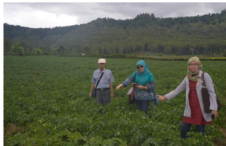
Gambar 3. Tim IbM berada ditengah lahan Demplot kentang, berumur 45 hari setelah tanam