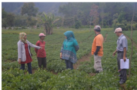
Gambar 4. Tim IbM tengah berdiskusi tentang pertumbuhan dan perkembangan tanaman, proses transfer teknologi dengan petani Mitra