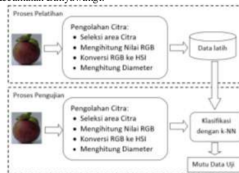
Gambar 1. Alur Sistem

Data citra yang akan di gunakan pada penelitian kali ini adalah 25 buah manggis dengan mutu 1, 25 buah dengan mutu 2 dan 25 buah dengan mutu super sebagai data training dan 15 buah manggis sebagai contoh uji. Buah-buah manggis ini di dapat dari petani di kecamatan Songgon Kecamatan Banyuwangi.