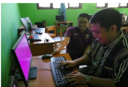
Gambar 3. Dokumentasi Diskusi trouble shooting