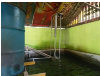
Gambar 4. Modifikasi sistem pendingin metode pancuran

Sistem pendingin yang dimodifikasi pada mesin vakum kapasitas 30 kg adalah : (1) kolam yang digunakan mempunyai dimensi panjang x lebar x tinggi berturut-turut 6 m x 3 m x 1,5 m dengan volume air 23-25 m 3 , (2) air pendingin yang keluar dari kondensor disemprotkan dengan