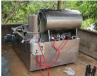
Gambar 1. Unit penggoreng vakum sistem water jet