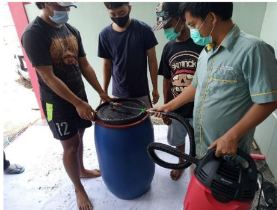
Gambar 4. Proses Vakum menggunakan Silo Modifikasi

Sebelumnya dijelaskan terlebih dahulu mengenai silo yang telah dimodifikasi serta manfaatnya untuk dijadikan dan diterapkan dalam pembuatan silase. Silo yang dimodifikasi merupakan silo yang diberikan tambahan komponen untuk meminimalisir adanya oksigen didalam silo saat proses fermentasi (Gambar 4).