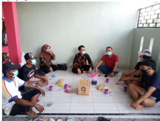
Gambar 1. Sosialisasi Pentingnya Penerapan Pengawetan Pakan

Adanya antusiasme dari peternak yang hadir menjadi Langkah awal untuk menerapkan teknologi yang telah dibuat oleh tim pengabdian. Hal ini dapat membantu dalam proses interpretasi dan penerapan teknologi khususnya teknologi pengawetan pakan yang dapat menjaga ketersediaan pakan di sepanjang tahun.