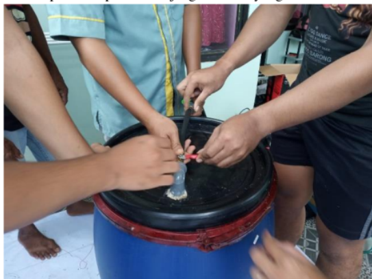
Gambar 3. Pembuatan Modifikasi Silo

Pengawetan pakan dilakukan untuk penyimpanan atau stok pakan untuk menjaga apabila ketersediaan pakan segar habis. Metode pengawetan pakan terdiri dari 2 jenis secara umum yang dikenal dengan metode pengawetan secara kering atau disebut dengan metode hay dan merode pengawetan secara basah atau disebut dengan metode silase. Metode hay dilakukan dengan memanfaatkan sinar matahari (penjemuran) atau dapat diangin-anginkan, namun dengan syarat tempat dijadikan untuk pembuatan hay tidak lembab sehingga proses pengeringan dapat berjalan dengan baik. Sedangkan metode pengawetan silase dilakukan dengan memanfaatkan bakteri untuk mendegradasi pakan agar dapat memperbaiki kualitas pakan, serta dapat disimpan dalam jangka waktu yang lama.