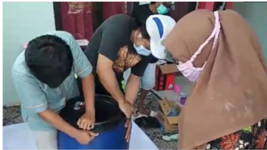
Gambar 2. Proses Pembuatan Silase

pengawetan pakan berbahan dasar pakan yang tersedia di Kawasan Kelompok Ternak Bago Mulyo (Gambar 2).