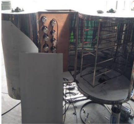
Gambar 4. Mesin Pengering "Food Dehydrator" Tipe Berputar

b). Penyerahan Alat Penyaring Food Dehydrator ke Mitra. Setelah desain alat dibuat maka selanjutnya dilakukan pekerjaan dalam pembuatan alat. Pembuatan alat dilakukan dibengkel las milik Pak Amal Bahariawan Kabupaten Jember. Hasil rancangan didiskusikan kembali untuk mendapatkan hasil yang sempurna dan sesuai dengan kebutuhan mitra. Setelah alat selesai dikerjakan kemudian diserahkan ke mitra dengan didampingi petunjuk dalam penggunaan alat tersebut (Gambar 5).