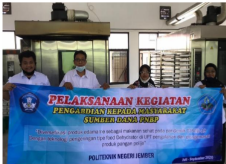
Gambar 5. Penyerahan Penyaring Tipe Rotary Drum Ke Mitra

b). Penyerahan Alat Penyaring Food Dehydrator ke Mitra. Setelah desain alat dibuat maka selanjutnya dilakukan pekerjaan dalam pembuatan alat. Pembuatan alat dilakukan dibengkel las milik Pak Amal Bahariawan Kabupaten Jember. Hasil rancangan didiskusikan kembali untuk mendapatkan hasil yang sempurna dan sesuai dengan kebutuhan mitra. Setelah alat selesai dikerjakan kemudian diserahkan ke mitra dengan didampingi petunjuk dalam penggunaan alat tersebut (Gambar 5).