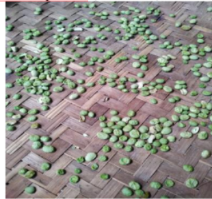
Gambar 6. Produk Dilakukan Pengeringan

Kegiatan ini dilakukan dengan mitra memberikan gambaran dan pemahaman disertai dengan penjelasan dari pelaksana kegiatan. Selain itu juga dilakukan diskusi dan tinjauan ke area produksi mitra. Diskusi yang dilakukan tentang pembersihan bahan baku, tata cara penanganan awal bahan baku, dan pengemasan produk (Gambar 6).