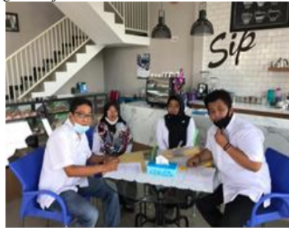
Gambar 1. Berkoordinasi dengan mitra

Penggorengan vakum dapat menurunkan sifat fungsional edamame yaitu hipoglikesemik. Sifat hipoglikesemik adalah sifat fungsional bahan pangan yang dapat menurunkan kadar lemak dan gula dalam darah. Sifat hipoglikesemik edamame dapat lebih baik atau meningkat jika edamame diolah dengan cara pengeringan menggunakan mesin food dehydrator. Berdasarkan hal tersebut akan dilakukan pengalihan proses pengolahan edamame kering yang sebelumnya dilakukan secara penggorengan dengan mesin penggorengan vakum menjadi secara pengeringan menggunakan mesin food dehydrator. Suhu optimum pengeringan edamame dengan food dehydrator adalah 85°C selama 3 jam. Ketebalan lempeng rak food dehydrator dan tekanan selama proses pengeringan berpengaruh pada kecepatan pengeringan dan kualitas sensorik edamame kering. Rancang bangun dan pengadaan food dehydrator sesuai kebutuhan akan dapat meningkatkan nilai tambah produk olahan edamame yang dihasilkan oleh UPT. Pengolahan dan Pengemasan Produk Pangan Polije.