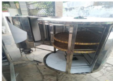
Gambar 3. Uji Coba Food Dehydrator

a). Penyuluhan dan Pelatihan. Kegiatan penyuluhan dan pelatihan ini dimaksudkan untuk memperkenalkan food dehydrator yang akan diberikan. Kegiatan ini dilakukan selama dua kali pertemuan yang terdiri dari pertemuan Forum Group Discussion (FGD) dan pelatihan. Kegiatan penyuluhan dilanjutkan dengan pelatihan bertujuan agar mitra dapat berperan serta aktif dalam kegiatan serta meningkatkan pemahaman terhadap teknologi yang ditawarkan. Kegiatan pelatihan dilakukan ditempat mitra sekaligus ujicoba alat. Penerapan teknologi dilakukan dengan didampingi oleh tim pengusul.