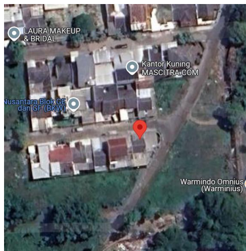
Gambar 1.2 Denah Kantor Cabang