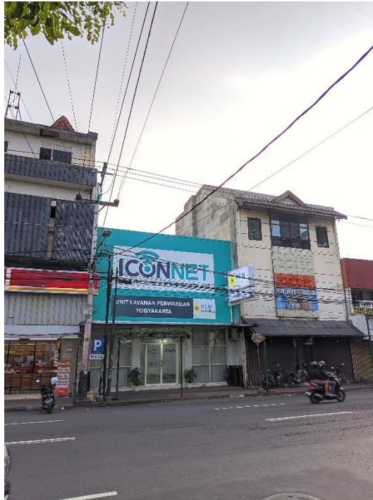
Gambar 1. 2 Gambar Lokasi dari Depan