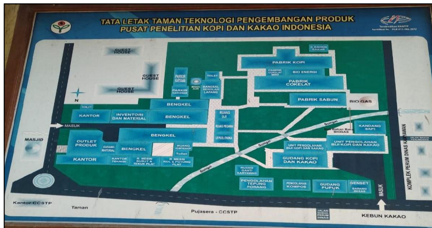
Gambar 1.2 Denah Perusahaan