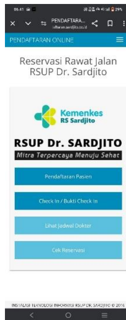
Gambar 1. 2 Tampilan Halaman Pertama Sistem Pendaftaran Online Pasien

Berikut merupakan tampilan awal sistem pendaftaran online pada website dan aplikasi ketika pasien ingin mendaftar. Hasil studi pendahuluan ditemukan permasalahan dimana salah seorang petugas mengatakan bahwa ada beberapa pasien yang kebingungan dalam memilih opsi cara bayar sehingga petugas harus menjelaskan lebih dulu cara bayar apa yang lebih tepat untuk di pilih pasien saat mendaftar dan terdapat beberapa pertanyaan yang kurang mudah untuk dipahami oleh pengguna yang menjadi penyebab waktu pengisian sistem yang mencapai 10-15 menit, sehingga masih kurang efisien permasalahan ini cocok untuk di evaluasi menggunakan variabel kemudahan.