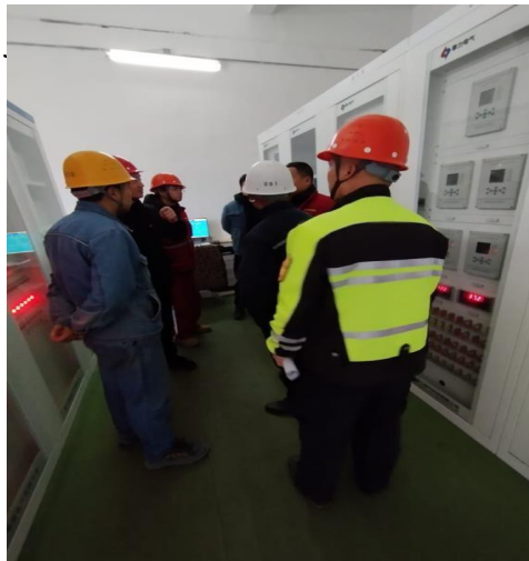
Gambar 1.2 Gambaran Umum Tempat Magang

Mahasiswa melakukan kunjungan ke lokasi magang di Jiangsu Delong Nickel Industry Co. Ltd. untuk mengevaluasi kondisi dan status tempat kerja serta memahami tanggung . mereka selama masa magang..