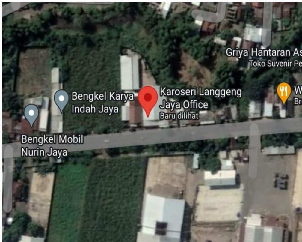
Gambar 1. 2 Bengkel Kedua