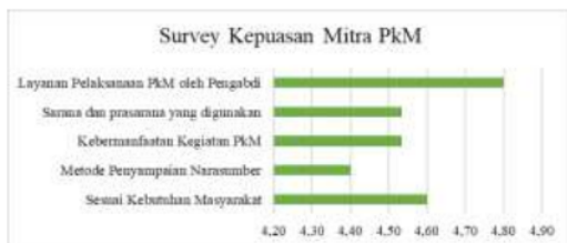
Gambar 7. Kepuasan Mitra

Kemudian, tim PkM mengevaluasi pelaksanaan PkM dengan menilai kepuasan peserta. Survey kepuasan dilakukan dengan membagikan kuesioner kepuasan dengan hasil sebagai berikut.