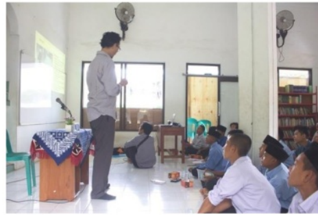
Gambar 4 Pemberian Materi Kewaspadaan Bencana

Kegiatan pada tahuapan ini meliputi pemberian materi-materi dasar terkait dengan kewaspadaan bencana dan evakuasi mandiri. Adapun materi yang disampaikan berupa