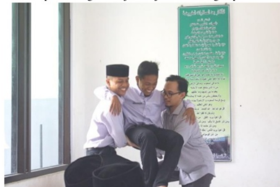
Gambar 5 Praktik Kewaspadaan Bencana

Kegiatan pada tahuapan ini meliputi pemberian materi berupa praktik terkait dengan bagaimana upaya perlindungan diri terhadap bencana. Dalam kegiatan ini santri diberikan simulasi perlindungan diri jika terjadi bencana gempa bumi