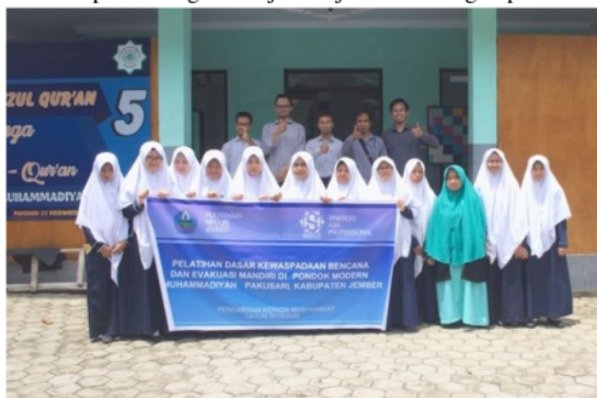
Gambar 6. Peserta Putri Pelatihan Kewaspadaan Bencana di Pondok Modern Muhammadiyah Pakusari

Kegiatan pada tahaapan ini meliputi pemberian materi berupa praktik terkait dengan bagaimana upaya perlindungan diri terhadap bencana. Dalam kegiatan ini santri diberikan simulasi perlindungan diri jika terjadi bencana gempa bumi