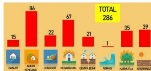
Gambar 3 Kejadian Bencana di Kabupaten Jember

Pada bagian ini menjelaskan kondisi bencana di kabupaten Jember