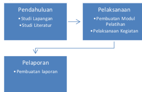
Gambar 1. Tahapan Pelaksanaan Kegiatan Kepada Masyarakat

Kegiatan pengabdian kepada masyarakat dibagi menjadi tiga tahapan utama seperti yang dijelaskan pada gambar 1 berikut ini