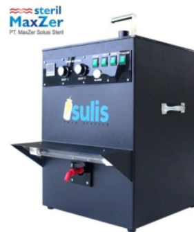
Gambar 1. Alat HPEF sistem batch

Peralatan yang digunakan : (1) Alat HPEF sistem batch (Gambar 1), alat pemeras jeruk, waterbatch.