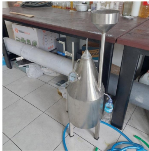
Gambar 2. Prototipe separator kapasitas 25 liter

Hasil uji fungsional menunjukkan komponen separator berfungsi secara baik sesuai dengan fungsinya baik secara individu mau pun dalam rakitan mesin. Uji rendemen minyak yang mampu dipisahkan oleh prototipe separator skala laboratorium ini tertera pada Tabel 3.