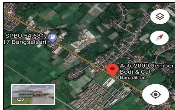
Gambar 1.1 GambarDenahLokasiAuto 2000 BP Jember