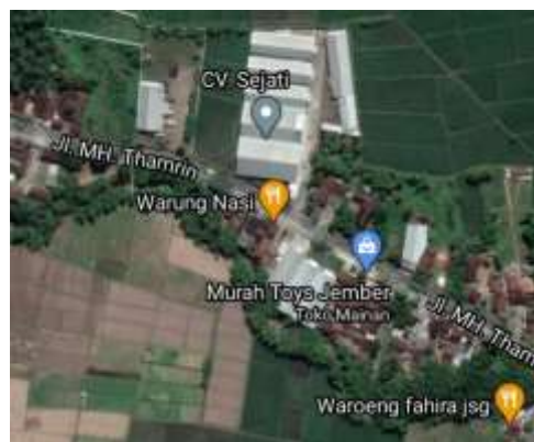
Gambar 1. 1 Peta lokasi PT. Intidaya Dinamika Sejati/CV Sejati