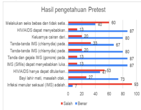
Gambar 5. Hasil Pre-Test Variabel Pengetahuan

Hasil rata-rata pengetahuan anggota TNI sebelum dilakukan edukasi kesehatan reproduksi adalah 7,33 dari nilai maksimal 10. Pertanyaan yang paling banyak “salah” yaitu Infeksi menular seksual (IMS) adalah penyakit yang penularannya utamanya melalui kontak fisik langsung dengan 93% menjawab salah, melakukan seks bebas dan tidak setia terhadap pasangan merupakan salah satu metode pencegahan IMS dan HIV dengan 60% menjawab salah, serta HIV/AIDS hanya dapat ditularkan melalui hubungan seksual dan tidak dapat ditularkan melalui pemakaian jarum suntik secara bergantian dengan pengidap HIV dengan 53% menjawab salah.