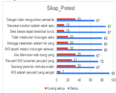
Gambar 7. Hasil Pre-Test Variabel Sikap

Sikap sebelum edukasi persentase setuju yang paling rendah ada di pernyataan dengan tidak mengucilkan penderita IMS maka akan menguatkan rasa percaya diri penderita IMS sebesar (67,3%) dan persentase setuju yang paling tinggi ada di pernyataan IMS adalah penyakit yang sangat berbahaya sehingga haruslah dihindari sebesar (93%).