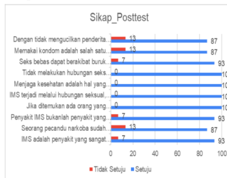
Gambar 8. Hasil Post-Test Variabel Sikap

Sikap setelah edukasi dapat dilihat persentase setuju terkecil di angka (87%) dan persentase terbesar sebesar (100%). Hal ini