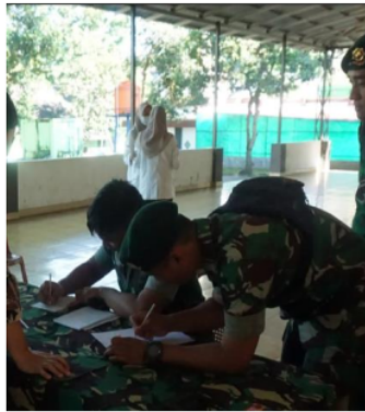
Gambar 1. Pre-test dan Post-test

Kegiatan Pre-test dilakukan pertama kali sebelum melakukan penyuluhan dan bertujuan untuk mengetahui sejauh mana tingkat pengetahuan sasaran tentang gizi untuk kesehatan reproduksi dan bahaya penyakit IMS, sedangkan kegiatan post-test dilakukan setelah penyuluhan dan bertujuan untuk mengetahui tingkat keberhasilan dalam penyampaian materi serta evaluasi.