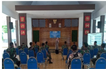
Gambar 2. Penyuluhan Pentingnya Kesehatan Reproduksi dan Bahaya IMS

Penyuluhan dilakukan menggunakan media power point dengan melampirkan materi dan gambar-gambar kesehatan reproduksi dan bahaya penyakit IMS. Materi yang disampaikan meliputi pengertian, penyebab IMS, jenis IMS, tanda dan gejala, komplikasi pada pria maupun wanita, dan upaya pencegahan.