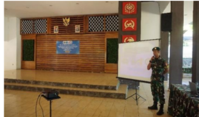
Gambar 3. Sesi Tanya Jawab

Kegiatan ini bertujuan untuk mengetahui tingkat pemahaman sasaran setelah diberikan materi dan sebagai sarana sharing apabila terdapat kasus-kasus yang berhubungan dengan gizi kesehatan reproduksi dan bahaya penyakit IMS yang masih belum dipahami.