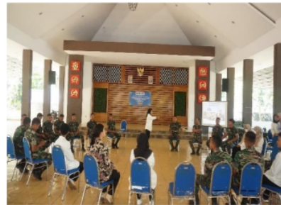
Gambar 4. Kegiatan ice breaking

Kegiatan ini bertujuan untuk menghilangkan kejenuhan setelah melakukan serangkaian tahapan dalam kegiatan pengabdian masyarakat dan melatih fokus pada peserta. Peserta terlihat antusias dalam kegiatan ini.