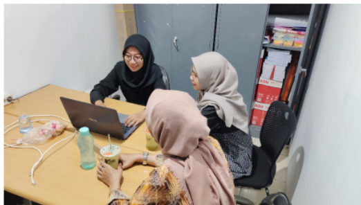
Gambar 3. Kegiatan Diskusi Jadwal Pelatihan Aplikasi

fiturnya, kemudian pemilik usaha diberi kesempatan untuk mencoba aplikasi dengan menginputkan semua data yang dibutuhkan, seperti data karyawan, supplier , data barang. Data yang telah diinputkan kemudian digunakan untuk mencoba fitur transaksi jual dan beli dan melihat laporan keuangan (pemasukan dan pengeluaran).