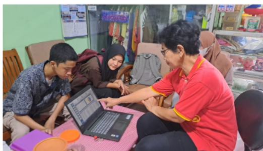
Gambar 4. Pelatihan Aplikasi

Berdasarkan hasil pelatihan penggunaan aplikasi, pemilik usaha mendapatkan kemudahan dalam melakukan pencatatan transaksi. Pencatatan barang menjadi lebih sistematis dan catatan pemasukan maupun pengeluaran dapat di monitor secara langsung. Dengan adanya aplikasi NanoApp , pemilik usaha mendapatkan solusi dari permasalahan yang selama ini dihadapi yaitu tidak adanya pencatatan keuangan.