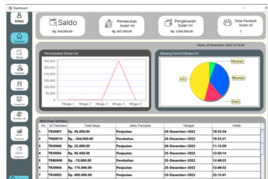
Gambar 2. Tampilan NanoApp

Berdasarkan wawancara dengan pemilik usaha Toko Kelontong Bu Hermin, permasalahan yang dihadapi adalah kesulitan dalam pencatatan transaksi. Hal ini mengakibatkan pemilik usaha tidak mengetahui aliran masuk dan keluar secara pasti. Dari permasalahan yang dihadapi, tim pengabdian masyarakat memberikan solusi dengan mengembangkan aplikasi pencatatan keuangan yang diberi nama NanoApp . Aplikasi NanoApp dapat membantu pemilik usaha untuk melakukan pencatatan transaksi secara sistematis. Fitur NanoApp yang ditawarkan antara lain, manajemen data karyawan toko, manajemen data barang, manajemen data supplier , pencatatan transaksi jual dan beli, laporan pemasukan dan pengeluaran. Tampilan NanoApp ditunjukkan pada Gambar 2.