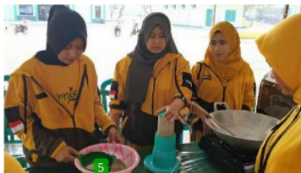
Gambar 4. Proses Pembuatan Tepung Tulang dan Kepala Ikan Lele

Pada tahapan ini, narasumber dari tim kegiatan pengabdian kepada masyarakat menjelaskan tahapan demi tahapan proses pembuatan olahan kerupuk dan brownies dengan substitusi tepung tulang dan kepala ikan lele. Tahap pelatihan dimulai dari proses pembuatan tepung tulang dan kepala ikan lele. Proses pembuatan tepung tulang diawali dengan cara merebus limbah tulang dan kepala ikan lele menggunakan panci presto selama 20 menit. Selanjutnya tulang dijemur hingga kering. Tulang yang sudah kering dihaluskan dan diayak. Proses pembuatan tepung tulang dan kepala ikan lele dapat dilihat pada Gambar 4.