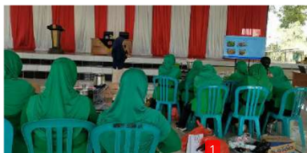
Gambar 3. Kegiatan Penyuluhan Pemanfaatan Limbah Tulang dan Kepala Ikan Lele menjadi Aneka Olahan

Pada tahapan penyuluhan, narasumber dari tim pelaksana kegiatan pengabdian masyarakat memberikan materi mengenai kandungan gizi serta berbagai olahan yang bisa dihasilkan dari tulang dan kepala ikan lele. Saat pemaparan materi berlangsung, peserta terlihat antusias dengan materi yang diberikan terlihat dari banyaknya pertanyaan yang disampaikan oleh peserta kepada narasumber. Sebelum digunakan, tulang dan kepala ikan lele diolah terlebih dahulu menjadi tepung. Hal ini bertujuan agar pemanfaatan limbah tulang dan kepala lele dalam pembuatan pangan olahan bisa lebih mudah dan praktis serta tidak merusak kandungan gizi di dalamnya. Kegiatan penyuluhan berlangsung secara interaktif sehingga penyampaian materi dapat secara maksimal diterima oleh peserta pelatihan. Kegiatan penyuluhan tentang pemanfaatan limbah tulang dan kepala ikan lele dapat dilihat pada Gambar 3.