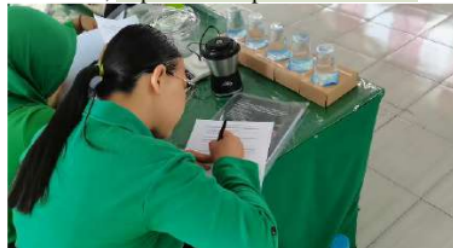
Gambar 2. Pengerjaan Soal Pre-Test oleh Peserta

Tahap penyuluhan merupakan tahapan kedua yang dilakukan pada pelaksanaan program. Kegiatan ini bertujuan untuk menyebar luaskan informasi dalam proses perubahan sosial agar terjadi peningkatan pengetahuan oleh peserta [9]. Kegiatan penyuluhan dilaksanakan di aula Yonif Raider 509 Kostrad Jember yang diikuti oleh 25 orang peserta anggota PERSIT. Sebelum kegiatan penyuluhan dilaksanakan, peserta mengerjakan pre-test berkaitan tentang olahan dari tulang dan kepala ikan lele untuk mengetahui pengetahuan awal yang dimiliki oleh peserta sebelum mengikuti kegiatan pelatihan [10]. Kegiatan pre-test yang telah dilakukan pada 28 Jul 2023, dapat dilihat pada Gambar 2.