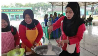
Gambar 5. Proses Pembuatan Kerupuk

Setelah proses pembuatan tepung tulang dan kepala ikan lele, tahapan pelatihan dilanjutkan dengan pembuatan olahan. Terdapat dua jenis olahan yang dibuat pada kegiatan pelatihan, yaitu kerupuk tulang lele dan brownies tulang lele. Pembuatan kerupuk diawali dengan proses pembuatan biang. Biang kerupuk merupakan campuran sebagian tepung tapioka dengan air yang dipanaskan sampai membentuk gel [11]. Biang dicampur dengan bahan yang lain ketika biang sudah dalam keadaan dingin. Pembuatan biang merupakan faktor yang penting dalam pembuatan kerupuk karena akan menentukan kualitas dari kerupuk yang dihasilkan. Selanjutnya biang dicampur dengan adonan lainnya sesuai dengan resep yang telah diberikan. Proses pembuatan kerupuk tulang dan kepala ikan lele dapat dilihat pada Gambar 5.