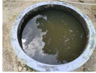
Gambar 1. Salah Satu Kolam Lele di Lingkungan Yonif Raider 509 Kostrad

Kolam lele yang dimiliki oleh Yonif Raider 509 Kostrad seperti yang terlihat pada Gambar 1 mampu menampung hingga 100 ekor ikan lele. Total rendemen daging pada ikan lele sekitar 50-60% dan isi perut 30%, dan sisanya adalah kepala dan duri [6]. Sehingga jika total ikan lele dalam 1 kolam sebanyak 100 ekor dengan total berat \pm 23 kg, maka jumlah limbah tulang dan kepala lele yang dihasilkan sebesar \pm 4 kg. Jumlah limbah tulang dan kepala lele yang melimpah memiliki potensi untuk dikembangkan menjadi produk pangan olahan.