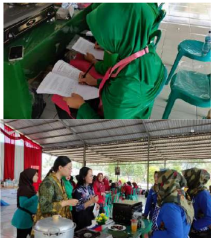
Gambar 7. Kegiatan Evaluasi Produk dan Evaluasi Pemahaman Peserta Pelatihan

Evaluasi merupakan salah satu komponen yang digunakan untuk mengukur baik atau tidaknya kegiatan pelatihan yang telah dilaksanakan [14]. Sehingga evaluasi menjadi tolak ukur tingkat keberhasilan akan kegiatan pelatihan yang telah dilaksanakan. Kegiatan evaluasi pada kegiatan pengabdian kepada masyarakat pemanfaatan limbah tulang dan kepala ikan lele menjadi aneka produk olahan dilakukan melalui evaluasi produk serta evaluasi pemahaman peserta. Kegiatan evaluasi dapat dilihat pada Gambar 7.