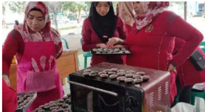
Gambar 6. Proses Pembuatan Brownies Kering

tepung terigu dalam pembuatan brownies. Proses pembuatan brownies dapat dilihat pada Gambar 6.