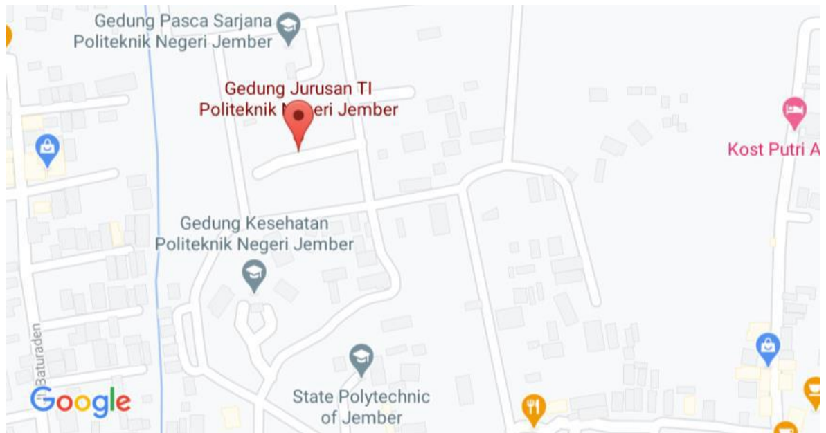
Gambar 1. 2 Peta Lokasi Jurusan Teknologi Informasi