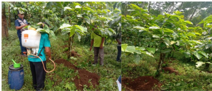
Gambar 5. Aplikasikan Teknologi Dekomposer Asal Rumen Sapi Pada Serasah Tanaman di Dalam Rorak Sekitar Tajuk Tanaman Kopi.

D. Telah dilakukan aplikasikan teknologi dekomposer asal rumen sapi di dalam rorak sekitar tajuk tanaman kopi yang telah diisi serasah tanaman diareal kebun Gunung Pasang.