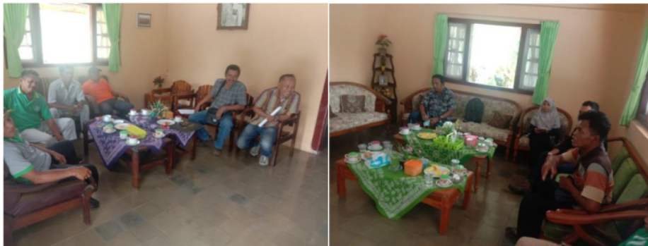
Gambar 3. Pelaksanaan Penyampaian Materi dan Diskusi Dengan Manajemen PDP Kahyangan dan Kebun Gunung Pasang

A. Penyuluhan: materi penyuluhan yaitu tentang pentingnya peningkatan bahan organik tanah dengan memanfaatkan serasah disekitar tajuk tanaman kopi dan peranan dekomposer asal rumen sapi untuk mempercepat proses dekomposisi dan mineralisasi serasah tanaman sebagai penyedia unsur hara tanaman.