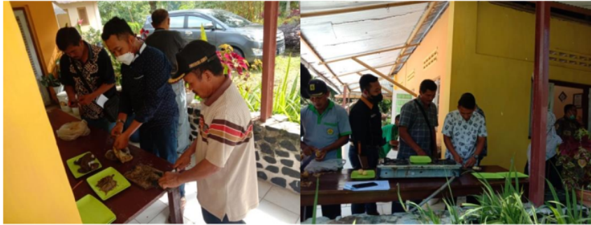
Gambar 4. Praktek Pembuatan Dekomposer Asal Rumen Sapi Oleh Manajemen PDP Kahyangan dan Kebun Gunung Pasang

Sinder Kebun Gunung Pasang, Mandor Afdeling Gentong, Mandor Afdeling Kaliputih, Mandor Afdeling Kaliklepu, Mandor Afdeling Gunung Pasang.