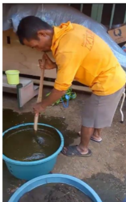
Gambar 2. Pelatihan Pembuatan Biogas Bahan Utama Limbah Kotoran Sapi

Hasil kegiatan yang telah dilakukan sampai pada tahap sosialisasi dan diskusi diantaranya dengan melakukan penyuluhan serta diskusi tentang potensi limbah kotoran ternak yang dilakukan dengan mitra. Sesuai dengan tujuan keberlanjutan kegiatan pengabdian masyarakat sebelumnya, mitra dibekali pengetahuan tentang manfaat, keunggulan, dan prospek peningkatan inovasi pengolahan limbah ternak untuk memproduksinya. Selain kegiatan penyuluhan dan diskusi, pada kegiatan ini juga dilakukan peninjauan langsung kandang sapi untuk mengetahui ketersediaan bahan baku. Dilakukan juga survei ketersediaan dan kelayakan bahan baku pembuatan pupuk yaitu kotoran sapi. Pada tahapan ini, tim juga melakukan koordinasi awal dengan mitra tentang perakitan biodigester untuk langkah awal mitra mengumpulkan bahan baku yang dikedendaki. Setelah melakukan tahap ini mitra mendapatkan motivasi dan antusias untuk memproduksi biogas dari limbah ternak dan limbah sayuran rumah tangga. Setelah kegiatan ini maka akan dilanjutkan kegiatan selanjutnya yaitu tahap pelatihan keterampilan.