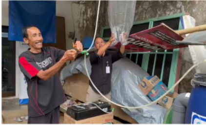
Gambar 4. Api Menyala Menunjukkan Keberhasilan Pembuatan Biogas Oleh Mitra

Pada tahapan evaluasi telah dilaksanakan evaluasi pengetahuan dan kemandirian mitra dalam melaksanakan hasil kegiatan pelatihan. Tahap evaluasi materi dilakukan dengan pemberian kuesioner untuk mengetahui sejauh mana peserta atau mitra dapat menerima materi yang telah disampaikan. Tahapan evaluasi dilakukan dengan menilai sejauh mana mitra mampu secara mandiri melakukan olah limbah kotoran ternak dan limbah dapur menjadi biogas dan POC siap pakai.