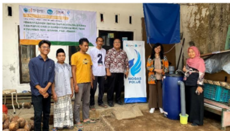
Gambar 1. Tim Pengabdian Beserta Anggota Gapoktan Makmur

Sasaran dari kegiatan Pemanfaatan Limbah Dapur Sebagai Biogas dan Pupuk Organik Cair (POC) di Gapoktan Makmur, Desa Kemuning Lor, Kecamatan Arjasa, Kabupaten Jember dengan Gapoktan Makmur adalah masyarakat dapat memanfaatkan limbah kotoran ternak menjadi lebih fungsional sehingga polusi teratasi dan dapat digunakan sebagai sumber terbarukan untuk menurunkan penggunaan bahan bakar fosil.