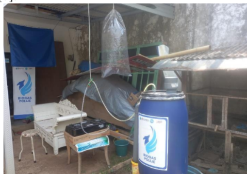
Gambar 3. Pemasangan digester dan plastic penampung biogas yang telah disusun beserta limbah kotoran ternak.

Pelatihan keterampilan pada mitra yang diberikan meliputi keterampilan untuk merubah limbah ternak sapi agar dapat menjadi biogas. Keberhasilan biogas sangat ditentukan oleh bahan dasar limbah dan takaran atau komposisi limbah dengan pelarutnya. Pelatihan keterampilan dan pendampingan dilakukan secara rutin hingga mitra dapat memproduksi biogas dengan berhasil. [9]. Pemanfaatan limbah dengan cara seperti ini secara ekonomi akan sangat kompetitif seiring naiknya harga bahan bakar minyak. Dari keterampilan memproduksi biogas maka diharapkan mitra dapat menghasilkan bahan bakar gas untuk kepentingan rumah tangga dan POC yang bisa digunakan dalam mensubstitusi pupuk kimia dalam kepentingan budidaya skala rumah tangga sendiri tanpa harus membelinya di toko-toko pertanian dengan harga yang relatif mahal. Komponen biogas adalah metan sebesar \pm 60\% , karbondioksida \pm 38\% , dan \pm 2\% N_2 , O_2 , H_2 , dan H_2S [5]. Biogas dapat dibakar seperti elpiji dan dalam skala besar biogas dapat digunakan sebagai pembangkit energi listrik sehingga dapat dijadikan sumber energi alternatif yang ramah lingkungan dan terbarukan. Biogas sebenarnya adalah gas metana ( CH_4 ). Gas metana bersifat tidak berbau, tidak berwarna dan sangat mudah terbakar [6].serta dalam pengapian berwarna biru [7].