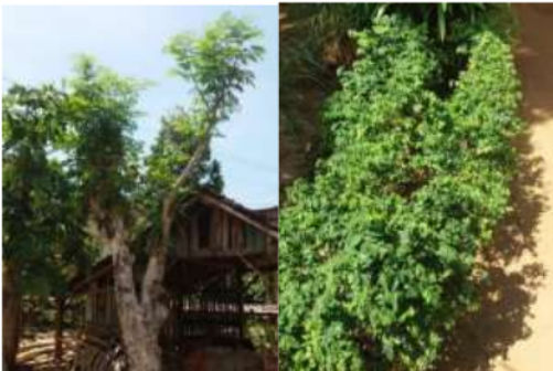
Gambar 1. Tanaman Kelor di Desa Mitra

Oleh karena itu, stunting menjadi prioritas utama yang perlu diatasi dengan memanfaatkan sumber pangan lokal yang melimpah di Desa Kemuning Lor, khususnya daun kelor. Hasil studi pendahuluan menunjukkan bahwa kelor banyak dimiliki oleh warga, baik ditanam di halaman rumah, pekarangan, maupun sebagai pagar. Hal ini ditunjukkan pada gambar 1.