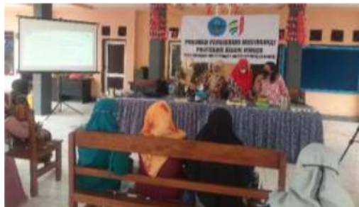
Gambar 5. Simulasi Membuat Es Krim Kelor oleh Peserta

Setelah dilakukan pelatihan, maka selanjutnya peserta diberikan kesempatan untuk melakukan simulasi membuat es krim kelor dengan tim PkM sebagai fasilitator. Berikut dokumentasi kegiatannya.