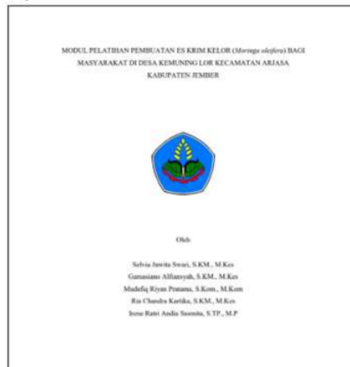
Gambar 2. Modul Pelatihan

Sebelum pelaksanaan, tim PkM mempersiapkan alat dan bahan. Alat yang dipakai berupa: (1) laptop; (2) LCD proyektor; (3) blender; (4) mixer; (5) kompor; dan (6) panci untuk memasak. Sedangkan bahan yang dipersiapkan antara lain: (1) 1 Liter Susu cair tawar; (2) 150 gram gula pasir; (3) 1 bungkus Susu Kental Manis (37 gram); dan (4) 50 gram daun kelor. Selain itu, tim PkM juga mempersiapkan modul pelatihan yang dapat digunakan oleh peserta sebagai pedoman dalam membuat es krim kelor. Berikut adalah tampilan dari modul pelatihan.