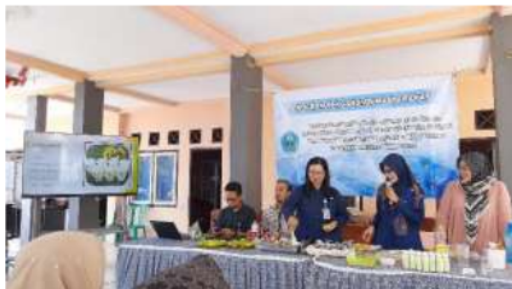
Gambar 3. KIE Kepada Peserta

Kegiatan PkM dilaksanakan pada tanggal 5 September 2021 di balai desa kemuning lor yang diikuti oleh 15 orang peserta. Peserta terdiri dari perwakilan perangkat desa, perwakilan ibu PKK, dan perwakilan kader. Kegiatan dimulai dengan penyuluhan kepada peserta tentang fungsi serta manfaat daun kelor. Berikut adalah dokumentasinya.