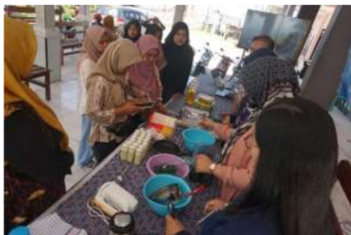
Gambar 4. Praktik Membuat Es Krim Kelor

Kemudian, kegiatan dilanjutkan dengan praktik membuat es krim kelor. Tim PkM mendemonstrasikan cara membuat es krim kelor dengan langkah sebagai berikut: (1) rebus daun kelor selama 5 menit; (2) blender halus daun kelor yang telah direbus bersama 100 ml air es, kemudian saring; (3) masukkan 50 gr Whipped Cream; (4) mixer Whipped Cream dengan air kelor; (5) tambahkan susu kental manis; (6) mixer kembali sampai tercampur rata dan mengental; dan (7) bekukan di lemari es. Berikut adalah dokumentasinya.