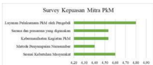
Gambar 7. Kepuasan Mitra

Kemudian, tim PkM mengevaluasi pelaksanaan PkM dengan menilai kepuasan peserta. Survey kepuasan dilakukan dengan membagikan kuesioner kepuasan dengan hasil sebagai berikut.