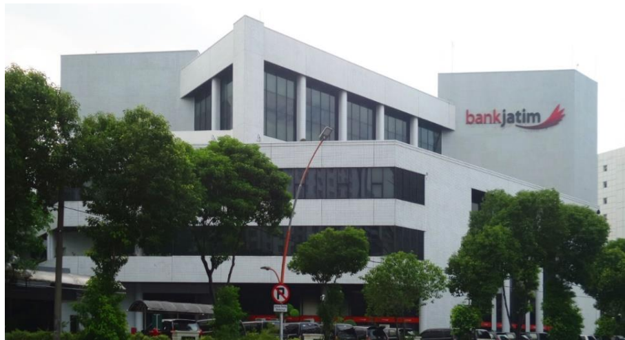
Gambar 1.1 Gedung Kantor Pusat Bank Jatim