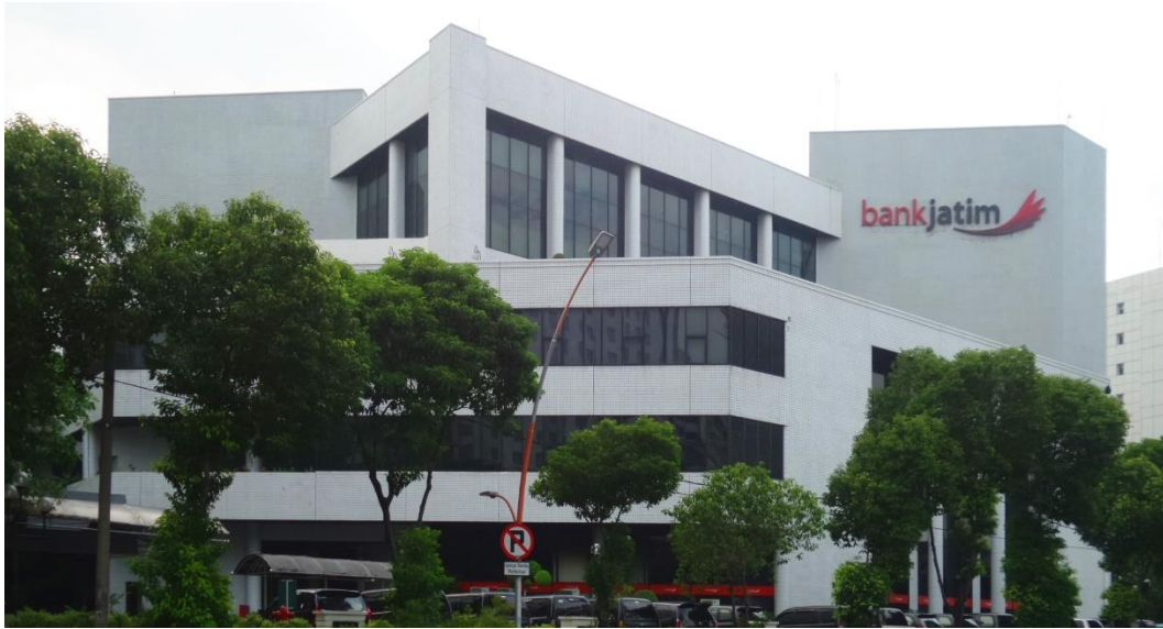
Gambar 1. 2 Gedung Kantor Pusat Bank Jatim