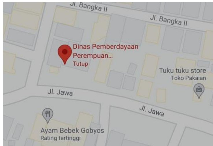
Gambar 1.3.2 Lokasi Kantor DPPAKB di Maps