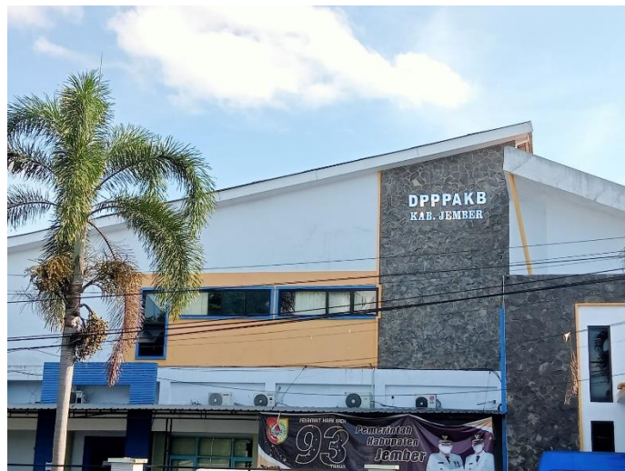
Gambar 1.3.1 Foto Kantor DPPPAKB

Lokasi kegiatan Praktik Kerja Lapangan (PKL) yaitu bertempat di DINAS PEMBERDAYAAN PEREMPUAN, PERLINDUNGAN ANAK, DAN KELUARGA BERENCANA KABUPATEN JEMBER yang terletak di Jl. Jawa No. 51 Kecamatan Sumbersari, Kabupaten Jember. Berikut merupakan gambar gedung dan lokasi petanya.