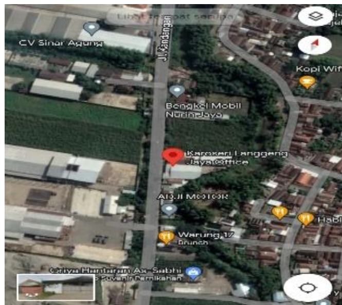
Gambar 1. 2 Bengkel Kedua