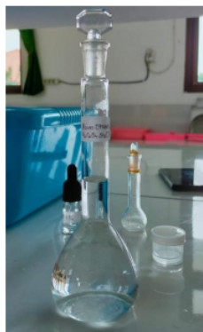
Gambar 2. Dokumentasi Pelarutan dan Pengenceran Bahan Kimia

Setelah sesi presentasi dan diskusi dalam ruangan, dilanjutkan dengan praktik di Laboratorium. Praktikum dimulai dengan mempersiapkan alat dan bahan sesuai dengan petunjuk yang telah disampaikan. Kemudian dilanjutkan dengan praktik melakukan penetapan kadar cuka makanan dengan metode titrasi asam – basa yang dibantu dengan beberapa asisten Laboratorium yang merupakan mahasiswa pada Program Studi Kimia, Fakultas Pertanian, Universitas Islam Kediri. Berikut ini adalah dokumentasi saat melakukan praktikum di Laboratorium, diantaranya adalah praktik pelarutan dan pengenceran bahan kimia (Gambar 1), pencampuran larutan sample asam cuka dengan indikator fenolftalein (Gambar 2), proses titrasi asam cuka dengan larutan NaOH 0,1 N (Gambar 3), dan hasil setelah sample dititrasi oleh NaOH (Gambar 4).