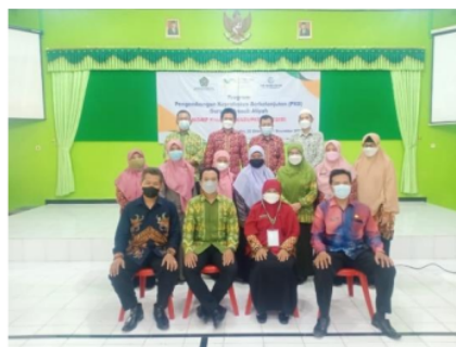
Gambar 1. Dokumentasi dalam Ruangan

Berikut ini adalah gambar kegiatan MGMP kimia Madrasah Aliyah se-Kabupaten Kediri saat selesai presentasi dan diskusi di ruangan aula (Gambar 1). Kemudian dilanjutkan dengan pembahasan praktik penentuan kadar cuka makanan dengan metode titrasi asam – basa di Laboratorium.