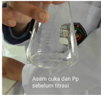
Gambar 2. Dokumentasi Pencampuran Asam Cuka dengan Indikator Fenofalein