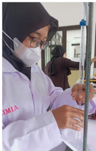
Gambar 3. Dokumentasi Pencampuran Sample Asam Cuka dengan Indikator Fenofalein