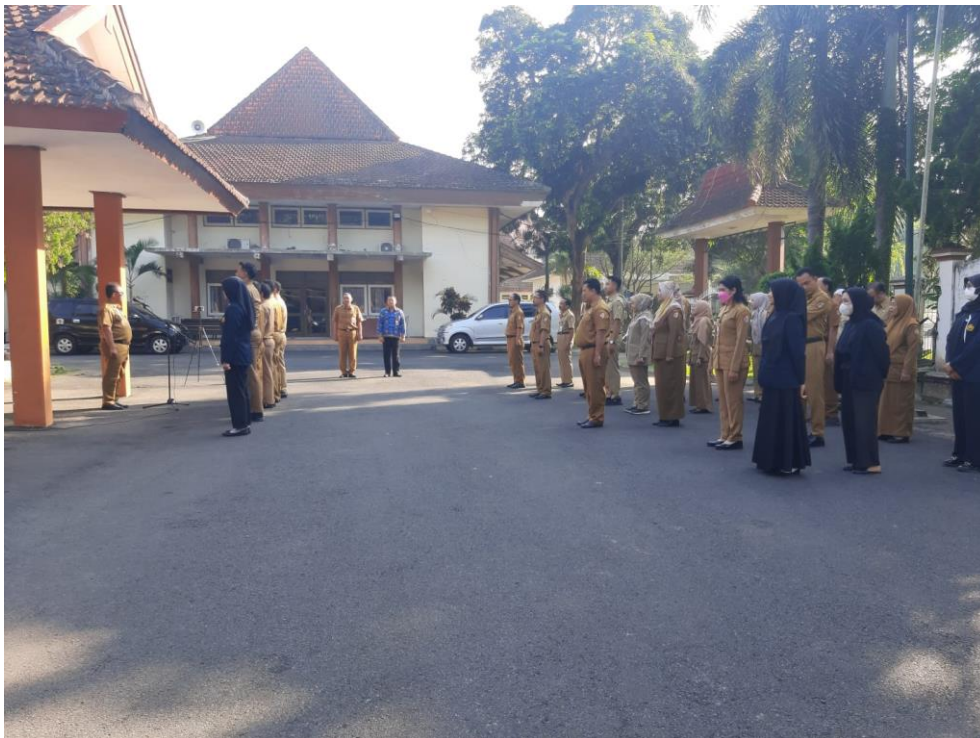
Gambar 3. 1 Kegiatan apel pagi

Apel Pagi merupakan kegiatan yang rutin dilaksanakan setiap hari senin pukul 08.00 WIB di halaman Kantor BKPSDM Kab. Jember yang diikuti oleh seluruh pegawai mulai dari Kepala Badan, Sekretaris, Kepala Bidang, Kasubag dan pejabat fungsional/pelaksana dengan membentuk formasi barisan yang dikelompokkan per bidang. Dalam Apel Pagi tersebut disampaikan beberapa amanat atau informasi dari Kepala BKPSDM selaku pembina apel, selain itu pembina apel mengingatkan pekerjaan selama satu minggu kedepan dan evaluasi pekerjaan selama seminggu sebelumnya. Dengan mengikuti kegiatan apel pagi ini mempunyai manfaat kedisiplinan bagi pegawai di jajaran BKPSDM Kab. Jember. Pada Gambar 3.1 ditunjukkan suasana apel pagi di halaman Kantor BKPSDM.