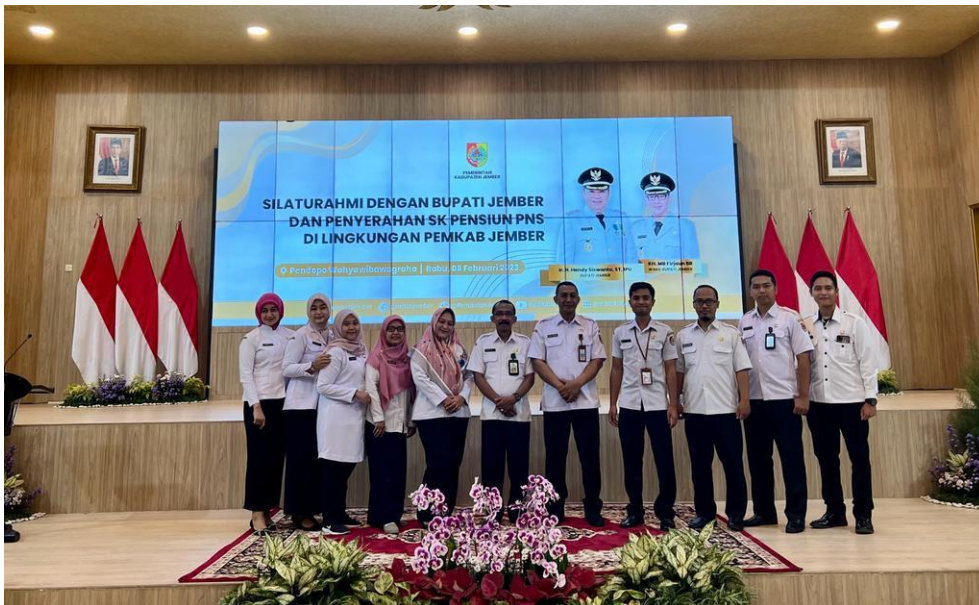
Gambar 3. 2 Kegiatan pembagian SK pensiun oleh Bapak Bupati Jember

Pada hari Rabu tanggal 8 Februari 2023 dilaksanakan pembagian SK pensiun merupakan kegiatan yang dilakukan bertempat di pendopo wahyawibawagraha Pemerintah Kabupaten Jember yang dihadiri dan diberikan secara simbolis oleh Bapak Bupati Jember yang rutin dilaksanakan setiap bulan. Pada kegiatan tersebut dilaksanakan pemberian SK pensiun bagi PNS di lingkungan Pemerintah Kabupaten Jember yang terdiri dari PNS tenaga Pendidikan, tenaga Kesehatan dan tenaga teknis lainnya. Manfaat dari kegiatan ini adalah sebagai bentuk penghargaan kepada para pensiunan yang telah mengabdikan kepada negara melalui Pemerintah Kabupaten Jember, agar para pensiunan tersebut mempunyai motivasi masih bisa berkarya dan bermanfaat dimana saja. Pada Gambar 3.2 menunjukkan tim yang mempersiapkan kegiatan tersebut.