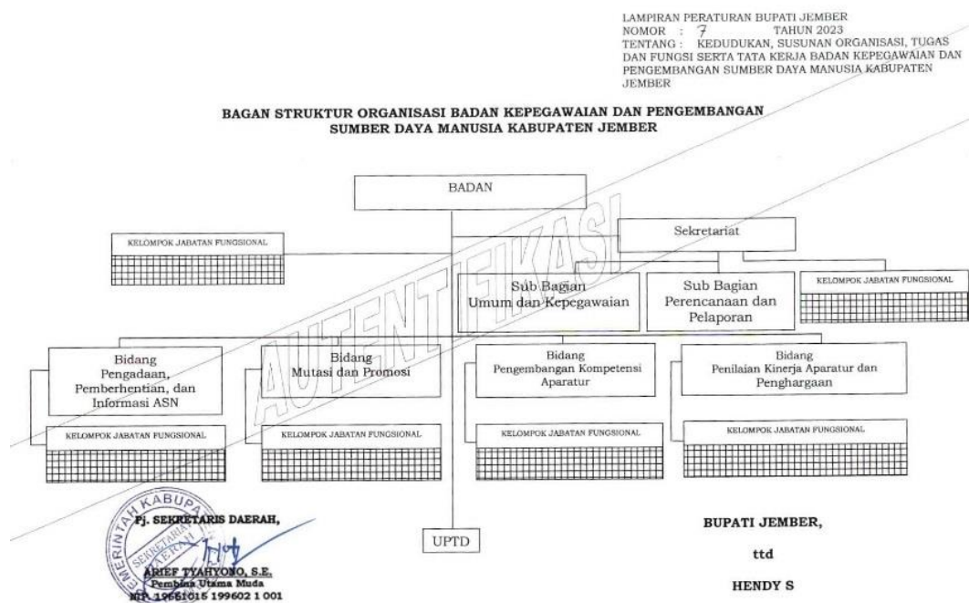
Gambar 2. 1 Struktur Organisasi Badan Kepegawaian dan Pengembangan SDM Kab. Jember

Struktur organisasi Badan Kepegawaian dan Pengembangan Sumber Daya Manusia (BKPSDM) Kabupaten Jember dapat dilihat pada Gambar 2.1