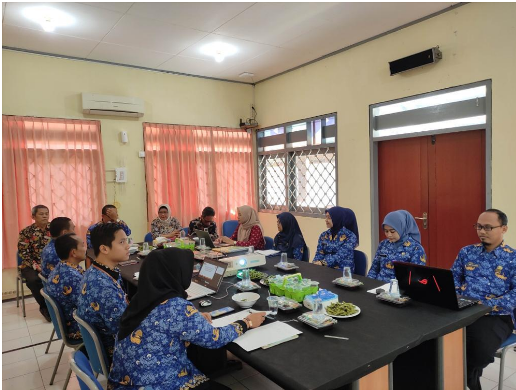
Gambar 3. 4 Rapat koordinasi dan evaluasi dengan BKN regional II Surabaya

ini merupakan bentuk kolaborasi dan agar sinergi antara BKN dan BKPSDM Kabupaten Jember semakin meningkat guna menindaklanjuti hal-hal yang menjadi kendala dalam layanan kepada PNS. Pada Gambar 3.4 menunjukkan suasana rapat koordinasi dan evaluasi bersama BKN regional II Surabaya