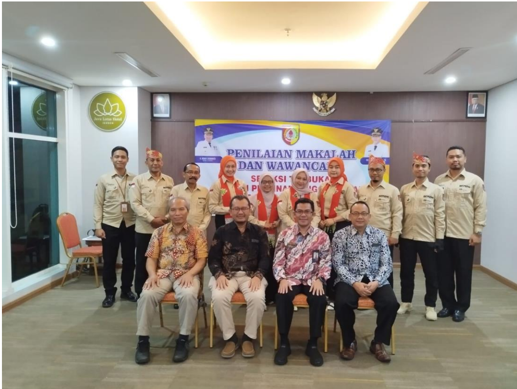
Gambar 3. 5 Penilaian kompetensi Jabatan

Gambar 3.5 merupakan tim penilai dari akademisi dan tim panitia penyelenggara dari BKPSDM Kab. Jember