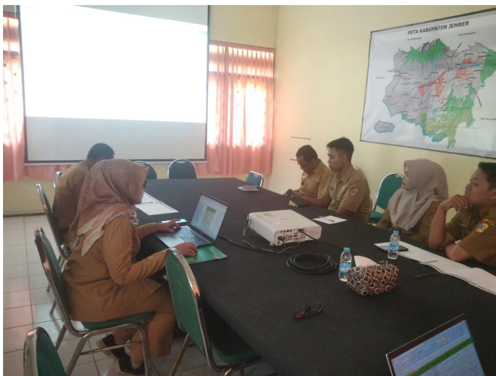
Gambar 3. 3 Kegiatan input data usulan Kenaikan Pangkat PNS

Pangkat bagi PNS dilaksanakan dalam satu tahun pada periode April dan Oktober, yang mana periode 01 April 2023 ini dilakukan mulai bulan Januari sampai bulan Maret. Manfaat dari kegiatan ini adalah sebagai layanan wajib yang diberikan kepada PNS di Kabupaten Jember yang nantinya akan berujung pada kenaikan gaji PNS dan mendapat peluang dinaikkan jabatannya di kemudian hari. Pada Gambar 3.3 ditunjukkan suasana input data di Aplikasi SIASN BKN secara bersama-sama.