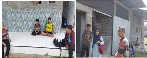
Gambar 2. Koordinasi bersama dengan Mitra

Kegiatan persiapan pengabdian kemudian dilanjutkan dengan pengurusan perijinan dan persiapan pengadaan alat dan bahan yang digunakan dalam kegiatan pengabdian kepada masyarakat berdasarkan hasil kesepakatan bersama. Kegiatan persiapan kemudian dilanjutkan dengan pembuatan modul pelatihan yang nantinya akan digunakan oleh mitra sebagai pedoman selama pelaksanaan kegiatan pengabdian. Pada modul ini berisikan mengenai prospek budidaya jamur tiram, syarat tumbuh jamur tiram, cara budidaya jamur tiram termasuk didalamnya bagaimana pemeliharaan konvensional dan smart kumbung, bagaimana proses diversifikasi olahannya, analisis usaha tani serta pemasarannya.