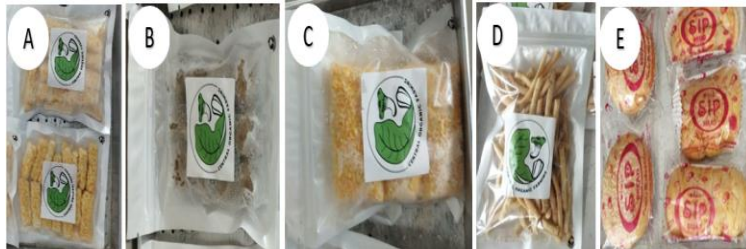
Gambar 9. nugget jamur (a), bakso jamur (b), nugget jamur (c), stick jamur (d) dan roti jamur (e)

jamur hasil sortasi grade rendah dibandingkan hanya dibuang begitu saja. Adapun produk olahan yang dilatihkan meliputi nugget jamur, bakso jamur, nugget jamur, stick jamur dan roti jamur (Gambar 9).