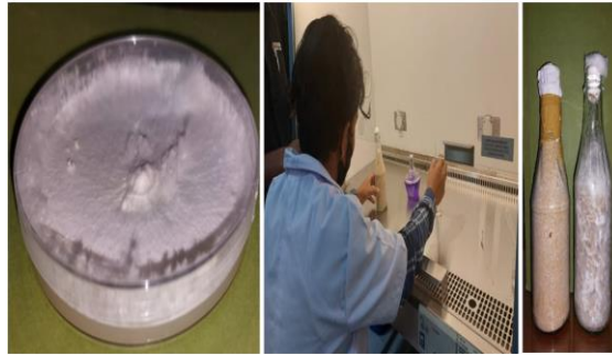
Gambar 7. Pembibitan F1, F2 dan F3 jamur tiram

Pada pembibitan F1 proses pertama yang dilalui yaitu isolasi yang berasal dari basidiospore pada badan buah jamur tiram indukan. Adapun kriteria dari jamur indukan meliputi jamur sudah berumur cukup dewasa atau 4 hari sebelum berkembang menjadi badan buah, pertumbuhan normal, kokoh dengan tingkat serangan hama penyakit yang minim sekali. Tahapan berikutnya yaitu isolasi yang merupakan penanaman eksplan dengan cara menyayat beberapa bagian tangkai pada pada jamur tiram indukan pada media PDA kemudian dilanjutkan dengan proses inokulasi yaitu penanaman jaringan pada media tumbuh. Keberhasilan bibit F1 ditandai adanya miselium berwarna putih yang tumbuh disekitar eksplan dan menyebar merata keseluruh tabung reaksi. Bibit hasil F1 kemudian diperbanyak miselium jamur (F2) pada media campuran serbuk kayu, bekatul dan dolomit. Bibit jamur F2 selanjutnya diinokulasikan ke dalam plastik polypropylene (baglog) kemudian diletakkan di ruang inkubasi dengan posisi cincin baglog diatas. Masa inkubasi memerlukan waktu 35 hari dengan kenampakan seluruh baglog telah berwarna putih oleh miselium jamur tiram. Perbedaannya proses inokulasi F2 dan F3 hanya terletak pada sumber inokulasinya. Sumber inokulasi bibit F2 berasal dari miselium biakan murni (F1) sedangkan F3 berasal dari miselium bibit F2. Selama pembuatan bibit harus diperhatikan kesterilan alat, ruangan, dan teknik inokulasi yang tepat.