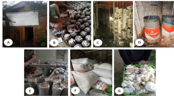
Gambar 1. Kondisi Mitra Sebelum Kegiatan Pengabdian (Keterangan: a. kumbung jamur, b. Inokulasi bibit Jamur dimana F2 dibeli dari luar, c. Kondisi dalam kumbung yang belum optimal, d. alat sterilisasi media yang masih sangat minim, e. pengisian baglog secara manual, f. gudang penyimpanan yang tidak terstandar, g. proses packing)

Adanya berbagai permasalahan ini, menuntut dibutuhkannya berbagai upaya melalui pendekatan holistic berbasis riset multidisiplin. Pendekatan tersebut dilakukan di tingkat produksi jamur, pengolahan jamur dan teknologi pemasarannya agar kegiatan usaha yang dilakukan oleh mitra dapat berjalan secara berkelanjutan. Hal ini diharapkan dapat meningkatkan pendapatan dan kesejahteraan mitra serta memajukan masyarakat sekitar. Upaya yang dapat dilakukan untuk mewujudkan hal tersebut antara lain dengan menerapkan berbagai teknologi yang telah diperoleh di Perguruan Tinggi melalui kegiatan Pengabdian Penerapan IPTEK Masyarakat (PIM) terutama dalam menanggapi situasi saat ini ketika musibah pandemic Covid-19 masih terus melanda di Tanah Air (Basori et al., 2020; Putra et al., 2019, 2020; Riskiawan et al., 2019; Riskiawan & Azhari, 2017; Rizaldi et al., 2016; Setyohadi et al., 2018). Adapun teknologi yang diterapkan pada kegiatan ini antara lain penyediaan bibit unggul melalui kultur jaringan, integrasi sistem IoT untuk optimasi iklim mikro dalam kumbung dan pengembangan pemasaran melalui diversifikasi produk didukung dengan sistem e-commerce. Tujuan diterapkannya teknologi tersebut dalam kegiatan pengabdian ini adalah untuk meningkatkan daya saing mitra dalam agribisnis jamur.