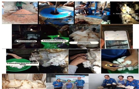
Gambar 6. Budidaya jamur tiram