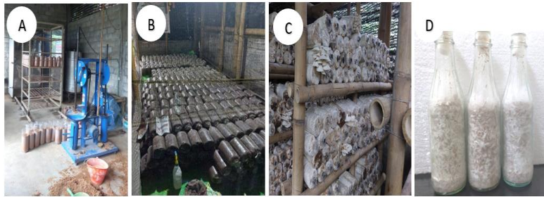
Gambar 5. Ruang persiapan media (a), ruang inokulasi dan inkubasi (b), ruang kumbung jamur tiram (c) dan bibit jamur tiram (d)