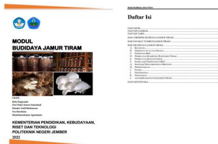
Gambar 3. Modul Budidaya Jamur Tiram

Kegiatan persiapan pengabdian kemudian dilanjutkan dengan pengurusan perijinan dan persiapan pengadaan alat dan bahan yang digunakan dalam kegiatan pengabdian kepada masyarakat berdasarkan hasil kesepakatan bersama. Kegiatan persiapan kemudian dilanjutkan dengan pembuatan modul pelatihan yang nantinya akan digunakan oleh mitra sebagai pedoman selama pelaksanaan kegiatan pengabdian. Pada modul ini berisikan mengenai prospek budidaya jamur tiram, syarat tumbuh jamur tiram, cara budidaya jamur tiram termasuk didalamnya bagaimana pemeliharaan konvensional dan smart kumbung, bagaimana proses diversifikasi olahannya, analisis usaha tani serta pemasarannya.