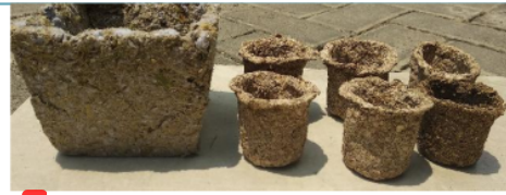
Gambar 5. Hasil Biodegradable pot

Pembuatan biodegradable pot yang berasal dari jerami padi dan sampah kertas dengan perbandingan 1:1 serta penambahan tepung tapioka yang berfungsi sebagai perekat yang berasal dari bahan alami dapat menghasilkan produk yang cukup kompetitif, dengan adanya perlakuan finishing saat pot sudah kering dengan pelapisan vernis dibagian luar pot dan pewarnaan pada pot membuat produk yang dihasilkan menjadi lebih menarik.