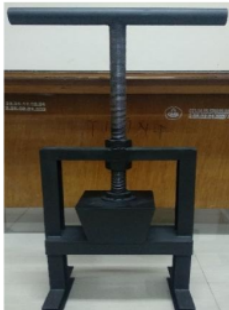
Gambar 4. Mesin Cetak Biodegradable pot

Mesin Press biodegradable pot dipakai untuk mencetak pot serta memeras atau menghilangkan kadar air pada adonan. Secara umum alat dibuat dari logam yang terdiri dari 2 bagian balok pencetak pot dengan menggunakan system bongkar pasang cetakan, badan mesin untuk tempat cetakan dan balok ulir digunakan untuk mengepres dan mengeluarkan kadar air pada adonan.