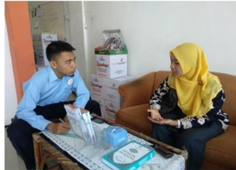
Gambar 1. Pertemuan dan diskusi dengan mitra.

Berdasarkan hasil diskusi antara tim pengusul bersama mitra, diperoleh solusi untuk mengatasi permasalahan yang ada berupa sosialisasi, pelatihan pembuatan biodegradable pot berbahan dasar kertas dan jerami serta metode pemasarannya, dan evaluasi kegiatan. Kegiatan pengabdian akan dilakukan dengan memberikan pemahaman terhadap mitra tentang pentingnya pengelolaan sampah, pengetahuan tentang kandungan dan jenis-jenis kertas dan jerami, proses pembuatan biodegradable pot , manajemen pemasaran produk yang dihasilkan dan evaluasi. Solusi permasalahan yang telah disepakati bersama tersebut dapat digambarkan sebagai berikut.