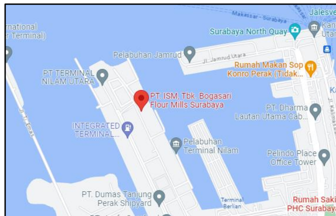
Gambar 1.1 Peta Lokasi PT ISM, Tbk. Bogasari Flour Mills Surabaya

PT. Indofood Sukses Makmur Tbk. Divisi Bogasari Flour Mills Surabaya terletak di Jl. Nilam Timur No. 16, Tanjung Perak - Surabaya. Perusahaan ini memiliki luas lahan \pm 14 Ha. Peta Lokasi PT. Indofood Sukses Makmur, Tbk. Divisi Bogasari Flour Mills Surabaya dapat dilihat pada gambar berikut.