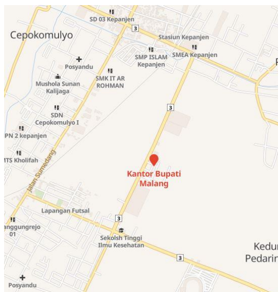
Gambar 1.1 Peta Lokasi PKL

Lokasi kegiatan praktek kerja lapang adalah pada DINAS KOMUNIKASI DAN INFORMATIKA KABUPATEN MALANG yang di Kantor Bupati Malang di Jl. Raden Panji No. 158 Lantai 9 Kapanjen Kabupaten Malang. Dan berikut merupakan peta lokasi pelaksanaan Praktek Kerja lapang (PKL) seperti Gambar 1.1.