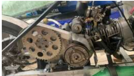
Gambar 1. 3 mesin dari Prototype Vehicle Argopuro

Perbedaannya dengan mesin KMHE 2019 terletak pada perubahan sistem ratio gearbox guna menunjang efisiensi bahan bakar pada mesin. Penjabaran dari tenaga mesin yang dihasilkan setelah melakukan pembakaran dalam sebagai berikut : Tenaga dari crankshaft menuju gear ganda lalu disalurkan ke ratio gearbox setelah itu disalurkan ke doclat (roda). Sistem ini kita pakai guna menunjang efisien bahan bakar pada Vehicle Prototype Argopuro .