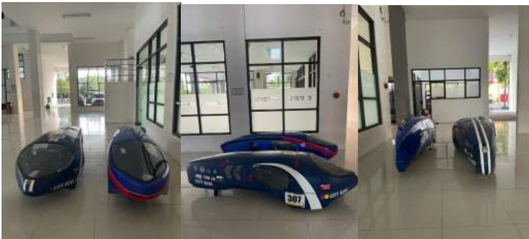
Gambar 1. 2 kendaraan team pablos 2019 dan 2022

Berikut gambar perbandingan hasil pengujian aerodinamis pada vehicle argopuro yang akan mengikuti perlombaan kmhe 2022 (warna hijau) dan kendaraan kmhe 2019 (warna biru), ada juga gambar perbedaan antara kendaraan tim pablos 2019 dengan yang terbaru. Dari hasil dan gambar yang sudah ada didapatkan bisa disimpulkan 60% kami melakukan perombakan guna menyesuaikan regulasi dan efisiensi yang didapatkan sangat maksimal.