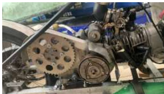
Gambar 1. 3 mesin dari Prototype Vehicle Argopuro

c).Mesin atau Engine . Pada tahun 2019 Tim Teknik Polije dengan kelas prototype pembakaran dalam gasoline menggunakan mesin sepeda revo injeksi tahun 2010 dan berhasil menjadi juara 2 pada perlombaan KMHE 2019 yang di selenggarakan di malang. Dengan spesifikasi standar hanya beberapa komponen yang diganti untuk menunjang konsumsi bahan bakar yang sedikit, akan tetapi mampu mendapatkan torsi daya yang mampu menunjang efisiensi bahan bakar. Pada tahun ini setelah melakukan riset kembali untuk engine yang kita gunakan masih sama dengan tahun 2019 yaitu mesin Revo FI, akan tetapi disini Team Pablos Politeknik Negeri Jember juga melakukan perubahan dengan tujuan meningkatkan efisiensi bahan bakar agar lebih sempurna, dalam artian mampu menunjang efisiensi bahan bakar lebih tinggi lagi.