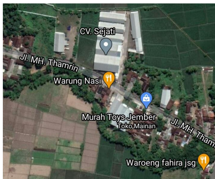
Gambar 1.1 Peta Lokasi PT Intidaya Dinamika Sejati/CV Sejati (Google Maps, 2020)